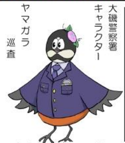
大磯警察署 キャラクター ヤマガラ 巡査