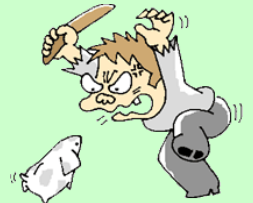
幻覚・妄想に悩まされ

☆ 幻覚、妄想などの精神障害により、殺人、強盗、放火などの凶悪な犯罪や、薬物を手に入れるために強盗や窃盗などの犯罪を犯したり、薬物の影響で正常な運転が出来ず交通事故を起こすなど、社会に大変悪い影響があります。