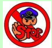
薬物乱用はあなたの人生を台無しに!