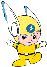
神奈川県警のマスコット ピーガルくん