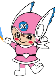
神奈川県警のマスコット