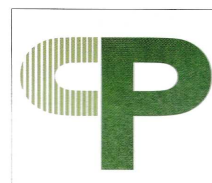
CPマーク CP部品だけが表示できる共通標準で Crime Prevention (防犯) の頭文字 を図案化したもの

※この目録については（公財）全国防犯協会連合会のホームページに掲載されています。