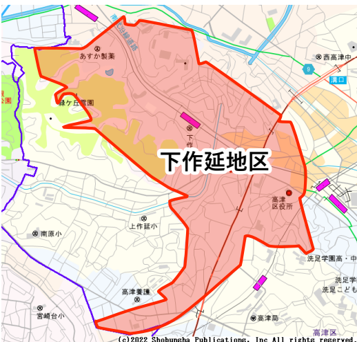
この地図の全部又は一部を複製することを禁じます。