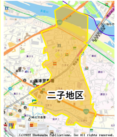
この地図の全部又は一部を複製することを禁じます。