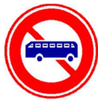
大型乘用车等禁止通行