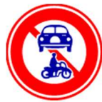
禁止车辆(组合)通行