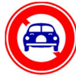
禁止二轮摩托车以外的汽车通行