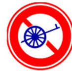
禁止自行车以外的轻型车辆通行