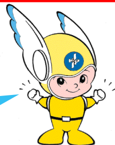
神奈川県警察のマスコット「ビーガルくん」