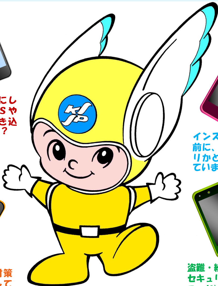
神奈川県警察のマスコット ピーガルくん