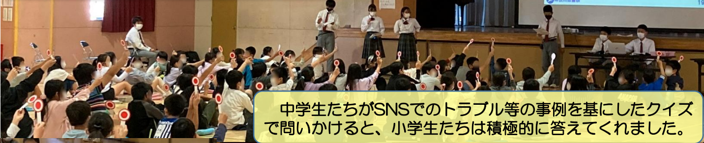
中学生たちがSNSでのトラブル等の事例を基にしたクイズで問いかけると、小学生たちは積極的に答えてくれました。