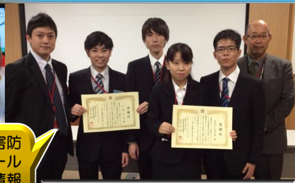
神奈川県防犯ボランティア「KAIT BLUE」(右)と文教大学(左)

平成28年9月から11月にかけて、児童の犯罪被害防止のために、コミュニティサイトのサイバーパトロール活動を積極的に行ったことから、警察庁生活安全局情報技術犯罪対策課長より神奈川県防犯ボランティア「KAIT BLUE」とともに感謝状を贈呈されました。