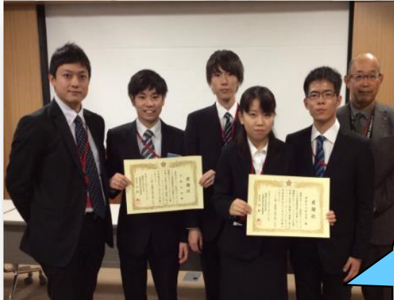
神奈川工科大学防犯ボランティア「KAIT BLUE」(右)と文教大学(左)

県警察とJ:COM 相模原・大和局が実施したイベントで、高校生ボランティアと協力して、来場した親子を対象にサイバー教室を実施しました。