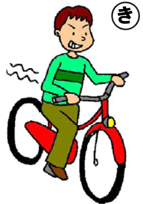
他の人の自転車に鍵がさしてあったので、自分の物にした。