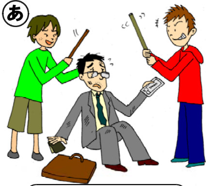
通りかかったおじさんを殴りお金をうばった。