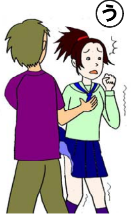
通りかかった女の人に「騒ぐと殺すぞ。」と言って脅かし、胸とお尻を触った。