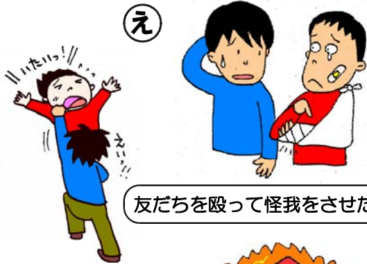
友だちを殴って怪我をさせた。