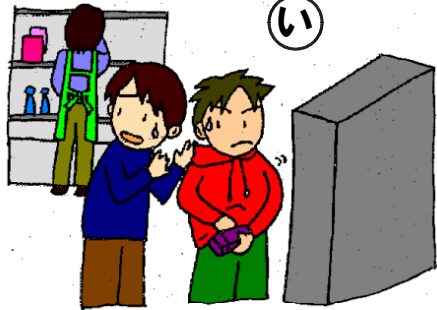
お金を払わず店の商品を持ち帰った。