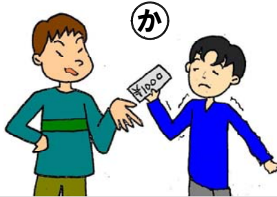
「お金払うのと殴られるのと、どっちが良い。」と脅かし、お金をもらった。