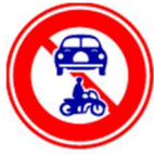
Cấm các phương tiện cắt ngang, băng qua đường