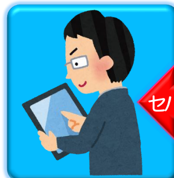
インターネットバンキング 専用のタブレット

ウイルス感染のリスクのあるメールやWeb閲覧を行うパソコンと、インターネットバンキングのパソコンを セパレート(分離) をして使いましょう！(感染に強いタブレットなら更にGood!)