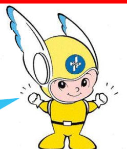
神奈川県警察のマスコット「ビーガルくん」