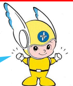
神奈川県警察のマスコット「ビーガルくん」