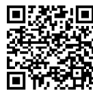
二次元バーコード