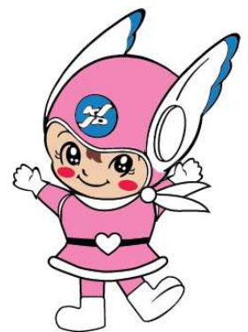
神奈川県警察シンボル・マスコット 「リリポちゃん」