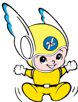
神奈川県警察シンボル・マスコット 「ピーガルくん」