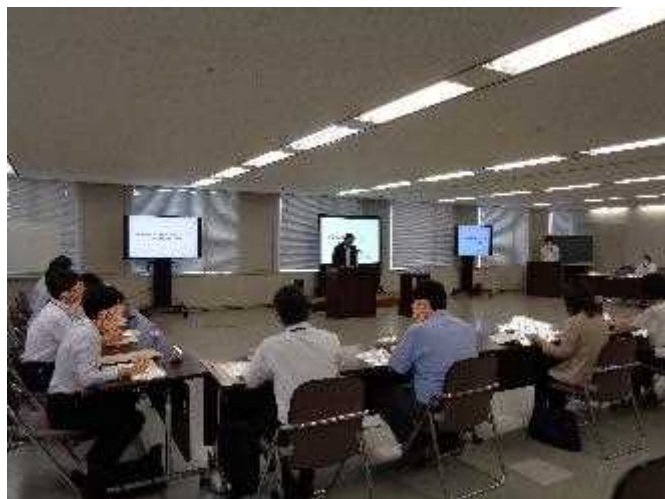
※一部画像を加工しています。