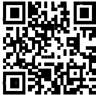
リスク&ケーススタディ編