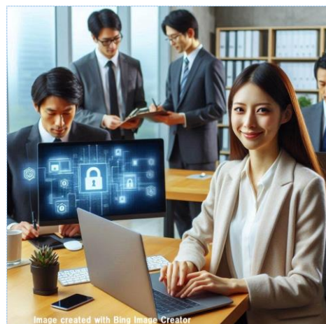
Image created with Bing Image Creator

DXを推進しビジネスを進化させるためには、サイバーセキュリティは切り離すことができない経営課題であり、負の投資と考えず、企業としての挑戦と、それに付随する責任と考えることが必要です。