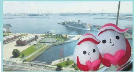
犯罪被害者等支援シンボルマーク 「ギュっとちゃん」