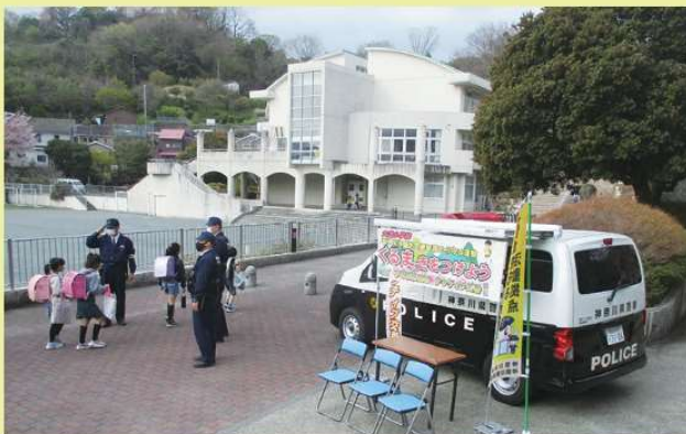
○児童の見守り活動

交番統合後の治安対策として、交番機能とパトカーの機動力を兼ね備えた「アクティブ交番」を32台導入（令和7年4月1日現在）し、統合した地域の駅前、公園、商業施設等で、落とし物や事件・事故等の受理、警察相談への対応、児童の見守り活動などを行っているほか、機動力を発揮してのパトロールも実施しています。