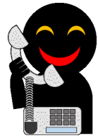
金融庁職員役 警察官役等

犯人の電話番号情報提供にご協力を 警察では、特殊詐欺の犯人検挙や新たな被害を防ぐため、犯罪に使われた電話番号を使えなくするため、皆様の情報提供をお願いしています。