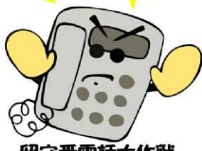
留守番電話大作戦

振り込め詐欺の被害が昨年よりも増加傾向にあります。騙されない方法に「いつも留守番電話」作戦が有効です。犯人は、家の固定電話にかけてくるので、家にいるときも留守番電話にしておけば、そこで撃退できます。自分は騙されないと、自分思い込みは捨て、大切な財産を守りましょう。