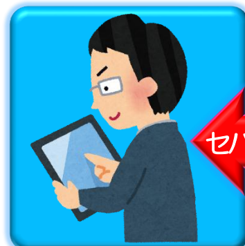
インターネットバンキング 専用のタブレット

ウイルス感染のリスクのあるメールやWeb閲覧を行うパソコンと、インターネットバンキングのパソコンを セパレート(分離) をして使いましょう！(感染に強いタブレットなら更にGood!)