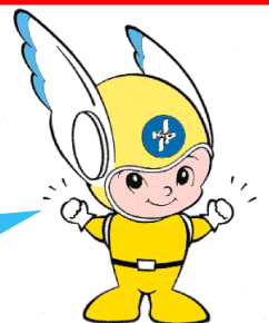
神奈川県警察のマスコット「ビーガルくん」