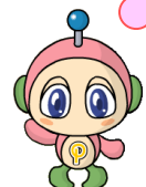
フレんディちゃん