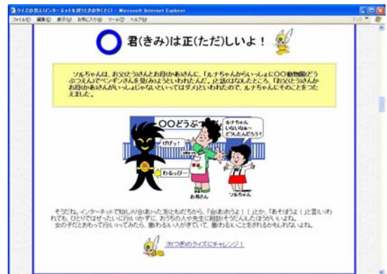
クイズの 答えの例